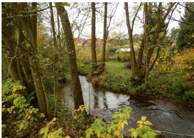
Lokalizace kritického bodu je v profilu rozlivu Fojtky do nivy v centru Mníšku

Rozliv Fojtky do zástavby Mníšku pod nádrží Fojtka. Kritický bod převzat v POVISu, ale jedná se již spíše o místo ohrožené říčními povodněmi.