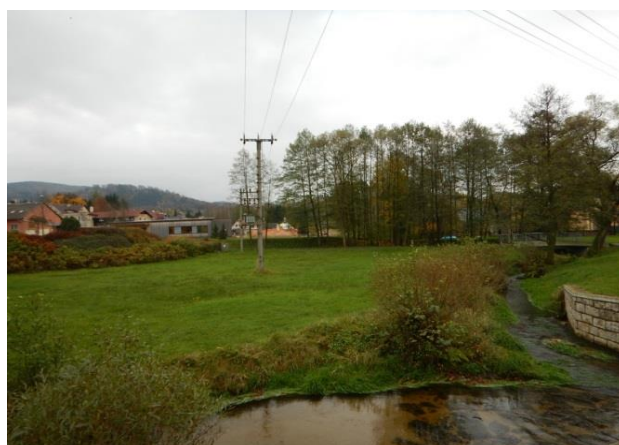
KB se nachází cca 200 m nad ústím Fojtky (vpravo) do Jeřice (teče zleva)